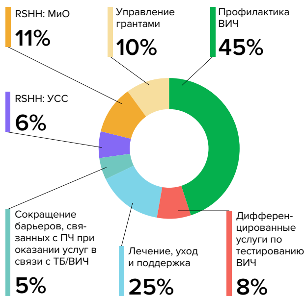
Диаграмма 2. Соотношение мероприятий общественных организаций, включенных в страновую заявку на финансирование Глобального фонда на 2024-2026 гг. 6